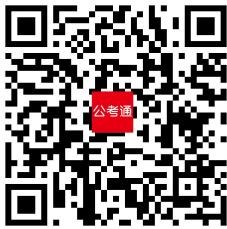
公考通 A. PP